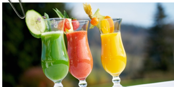
Typische Heilfasten Obst- und Gemüsecocktails

Während des Fastens baut der Körper alles ab, was ihn belastet. Gift- und Schlackenstoffe werden in erster Linie über den Darm ausgeschieden, aber auch Nieren, Lunge, Haut, Zunge und Leber sind wichtige Organe für den Entgiftungs- und Ausscheidungsprozess. Zahlreiche Beschwerden, wie zu hoher Blutdruck, zu hohe Blutfettwerte, Magen-Darm-Beschwerden und Gewichtsprobleme werden positiv beeinflusst.