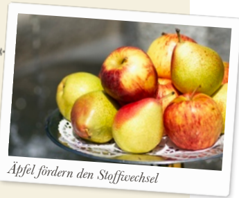
Äpfel fördern den Stoffwechsel

Am Abend habe ich mir noch mehr Zeit für die Brühe und die Säfte genommen. Morgen gibt es wieder feste Nahrung. Noch zwei Tage und dann heißt es schon wieder Abschied von Oberstaufen nehmen. Ich möchte ehrlich gesagt noch gar nicht daran denken.