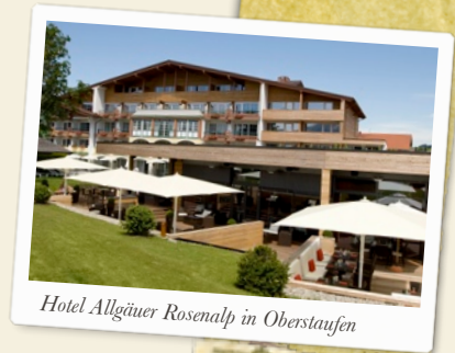
Hotel Allgäuer Rosenalp in Oberstaufen

Heute hatte ich einen etwas unruhigen Schlaf. Mein Mund ist heute Morgen sehr trocken und die Zunge belegt. Es beunruhigt mich nicht, da ich das vom Fasten kenne. Der Körper baut alles ab, was ihn belastet. Die Gift- und Schlackenstoffe werden nicht nur über den Darm ausgeschieden, sondern z. B. auch über die Zunge. Die belegte Zunge kann in den ersten Tagen des Fastens vorkommen und ist nichts Schlimmes. Ich habe auch ganz leichte Kopfschmerzen nach dem Auf-