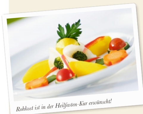
Rohkost ist in der Heilfasten-Kur erwünscht!

Am Mittag gab es eine klare Gemüsebrühe und zwei Fruchtsäfte. Als Dessert einen Apfel. Auch beim Mittagessen nahm ich jeden Bissen bewusst wahr.