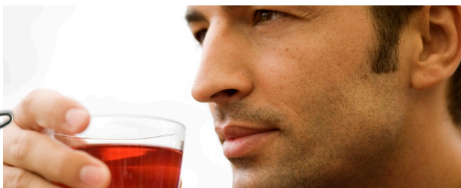
Die Heilfasten-Kur: Für Jedermann und Jede(r)frau