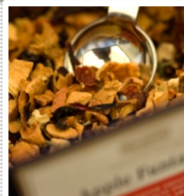
Frisch & Duftend: Unser Tee

Durch reichliche Flüssigkeitszufuhr wird der Körper währenddessen mit allen erforderlichen Nährstoffen versorgt.