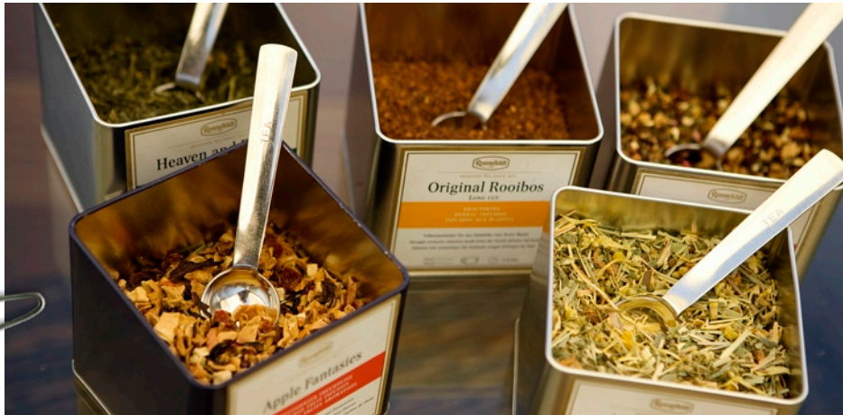
Reichliche Flüssigkeitszufuhr: Ein grundlegender Baustein der Heilfasten-Kür