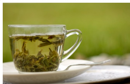
Tee: eine weitere, wichtige Säule im Heilfasten-Konzept